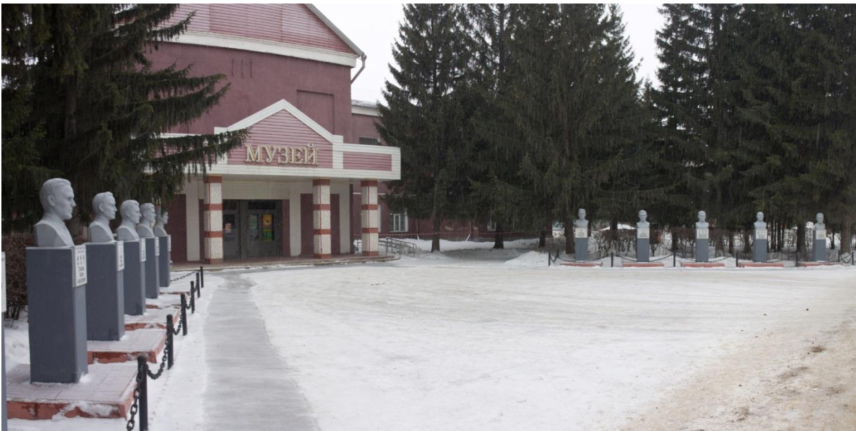
Фото 18. Аллея Славы Героев Советского Союза и полных кавалеров ордена Славы трех степеней. С 2005 года.

Реконструкция аллеи Славы в парке 1985 год.