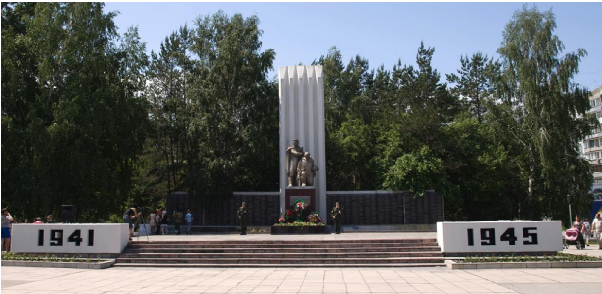
Фото 6. Мемориал воинам-искитимцам, павшим в годы Великой Отечественной войны 1941-1945 гг с 1985 года и по настоящее время.