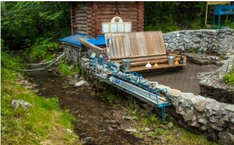
Фото 14. Святой источник