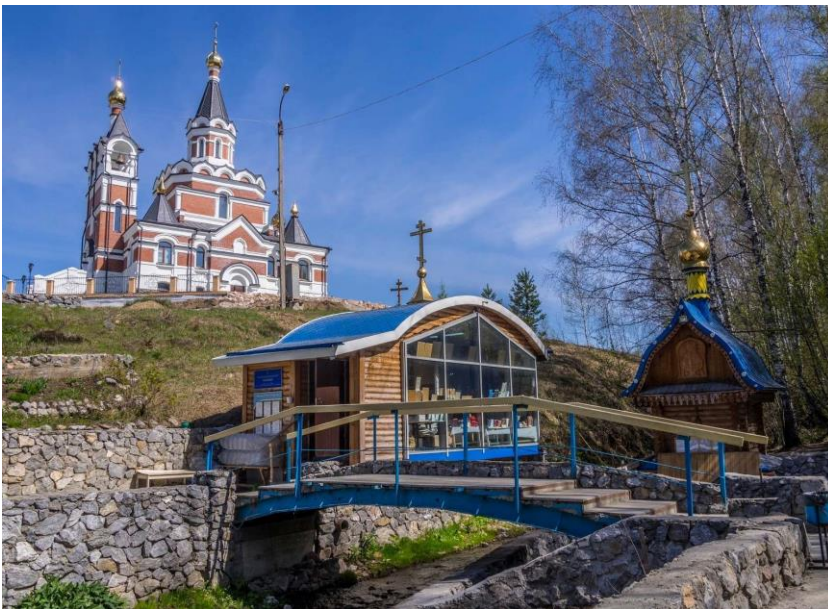
Фото 15. Святой источник