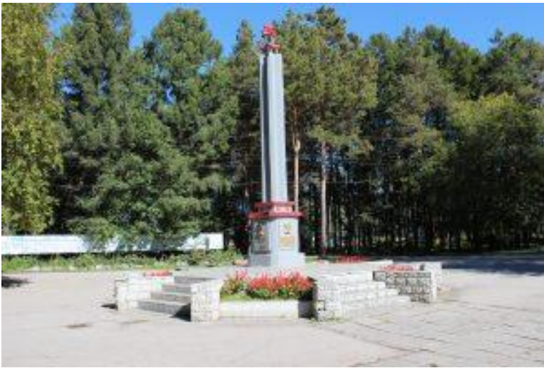
Фото 22. Памятник И.В.